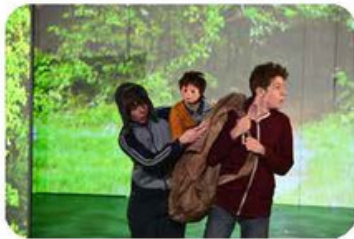
22 février Théâtre de Fos 04 42 11 01 99 ♦ scenesetcines.fr

La Cie AsaNsaiMA s'empare d'un classique de la littérature jeunesse signé Jean-Claude Mourlevat , L'enfant Océan , lui-même inspiré du Petit Poucet . Yann, 7 e enfant de la famille Doutréleau, est resté très petit. Atypique, méprisé par ses parents pour son goût des livres, il grandit entre la main lourde du père et celle, leste, de la mère. Jusqu'au jour où, tenaillé par la crainte d'une issue fatale, il entraîne sa fratrie dans une échappée vers la mer...