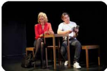
27 février Théâtre de Fos 04 42 11 01 99 ♦ scenesetcines.fr