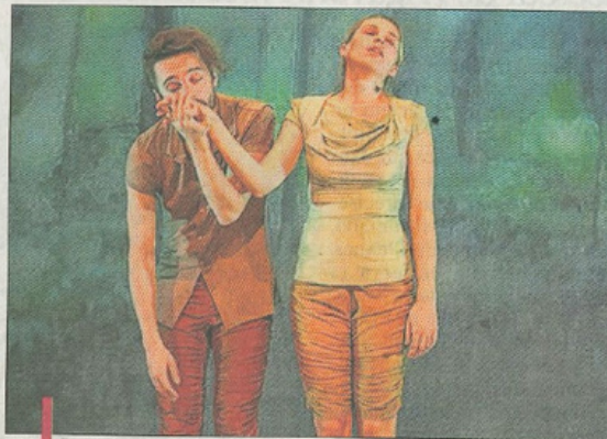
La pièce "La dispute", c'est ce soir à la salle polyvalente.